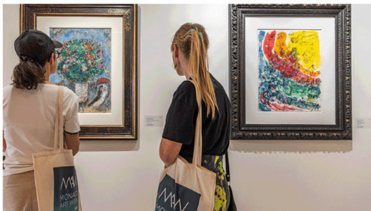
Galerie Sotheby's