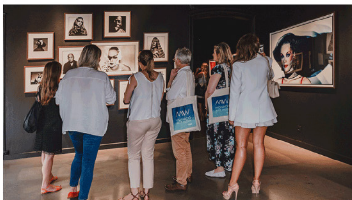
G &amp; M Design Gallery, photographe David Bailey