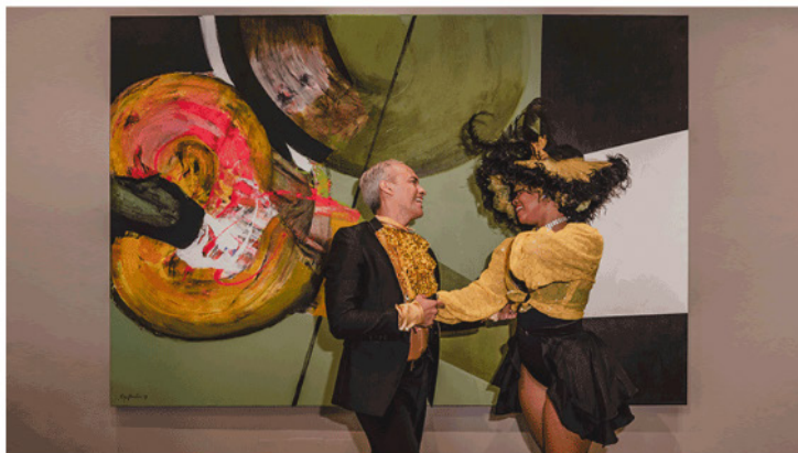
Kamil Art Gallery, artiste Olga Sinclair © Alice Bensi

HOFA a opté pour les œuvres imprégnées de comédie de l'artiste irlandaise Mary Ronayne. Pour sa première, Lebreton présente une sélection de céramiques, sculptures et estampes réalisées par des artistes ayant travaillé sur la Côte d'Azur dans la seconde moitié du XX e siècle. Des créations signées Pablo Picasso ou encore Jean Cocteau, dont les œuvres réalisées à Santo Sospir font actuellement l'objet d'une exposition à la Villa Sauber.