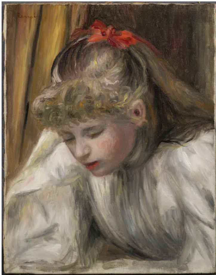
Pierre-Auguste Renoir, Jeune Fille lisant, oil on canvas, 41 x 32.4cm, Private Collection.

"Impressionism: Painting from Nature" presenta opere di alcuni dei più grandi nomi del movimento impressionista. Spiccano "Jeune Fille lisant" (1890) di Pierre-Auguste Renoir , una tenera rappresentazione di una giovane ragazza assorta nella lettura di un libro, due paesaggi sempre di Renoir e ulteriori vedute bucoliche della campagna di Jean-François Millet e, dall'altra parte dell'Atlantico, Childe Hassam . Il post-impressionismo è rappresentato da Édouard Vuillard con "Madame Vuillard cousant" (1895) e la brillante natura morta "Fleurs rouges" (1892) di Pierre Bonnard . La mostra durerà fino al 21 luglio.