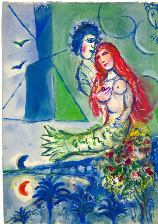
Chagall – Gouache préparatoire pour la lithographie d'interprétation Sirène au poète