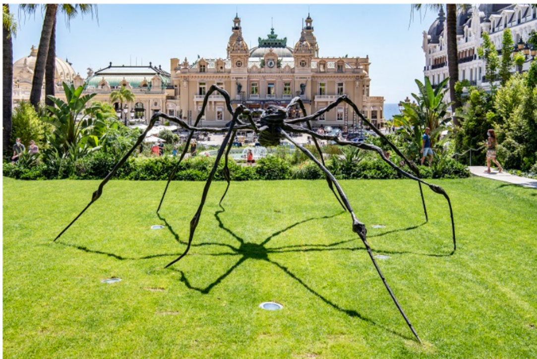
MAW 2021. Louise Bourgeois, Maladie de l'Amour, Hauser & Wirth Monaco, 2021. © The Easton Foundation/VAGA at ARS, NY. Licensed by VAGA at ARS, NY. Ph. Alice Bensi

Tra gli eventi artistici più attesi e originali dell'estate culturale monegasca, la Monaco Art Week si svolgerà dal 12 al 17 luglio 2022 offrendo un nuovo percorso alla scoperta delle numerose mostre organizzate dalle gallerie e case d'asta partecipanti.