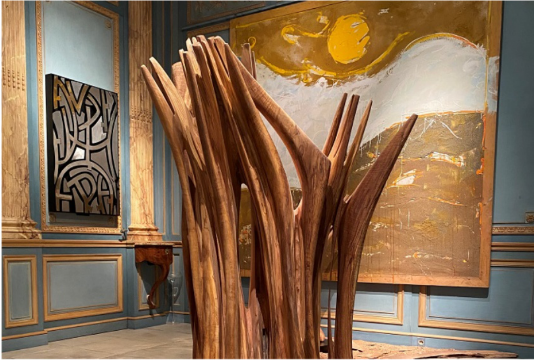
MAW 2022, Pablo Atchugarry, Prométhée, détail, Galerie Adriano Ribolzi