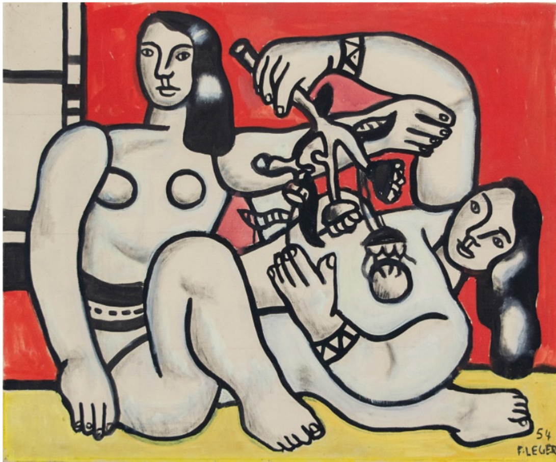
MAW 2022, Fernand Léger, Deux femmes tenant des fleurs, 1954 Oil on canvas, 54.3 x 65 cm, Presented by Opera Gallery

La manifestazione, posta sotto l'Alto Patronato di S.A.S. il Principe Alberto II di Monaco, si iscrive in un denso calendario culturale, beneficiando del dinamismo del salone artmontecarlo e delle numerose esposizioni organizzate in Costa Azzurra. Da La Condamine al Larvotto, passando per Monte-Carlo, la MAW offrirà un'esperienza varia e itinerante attraversando epoche e correnti artistiche diverse.