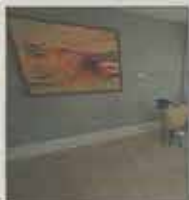
Étonnant paysage abstrait de Zao Wou Ki.