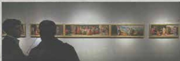
Une série de toiles datant du XVII e siècle chez Moretti.